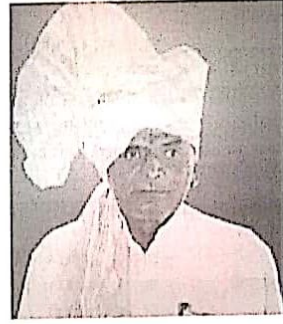
ये. मगनशेट महादु गाडगे यांच्या पवित्र स्मृतीस